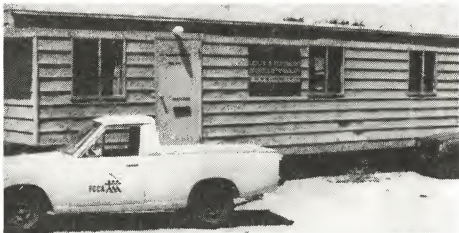
Esaki ta e centro di informacion pa e proyecto di renovacion di Village y Esso Heights situa den St. Maartenstraat. E proyecto lo costa 22 milyon florin y lo mejora e clima di vivienda den e burhonan en cuestion. Recientemente Gobierno a cumpra e prome dos casnan den Village cu lo ser benta abow pa asina cuminsa cu e proyecto

Ta significante pa menciona cu e mayoria grandi di noticianan publica den diarianan local tocante e trabowan cu Gobierno Insular ta efectua pa pueblo, ta procedente di A.V.D.